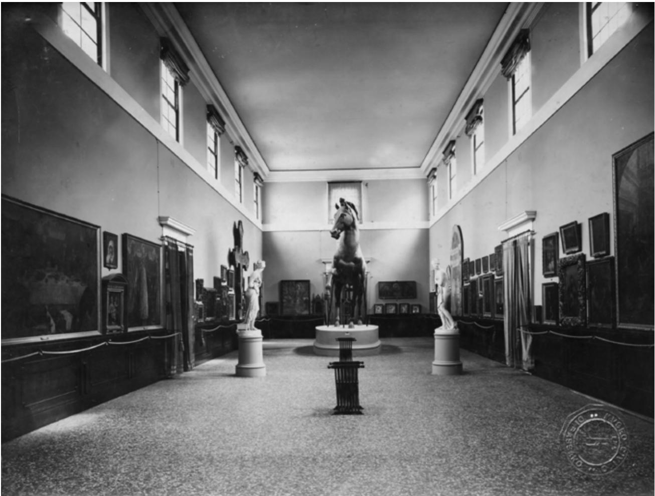
2. Salone Canova, Museo Civico di Bassano del Grappa, 1926.