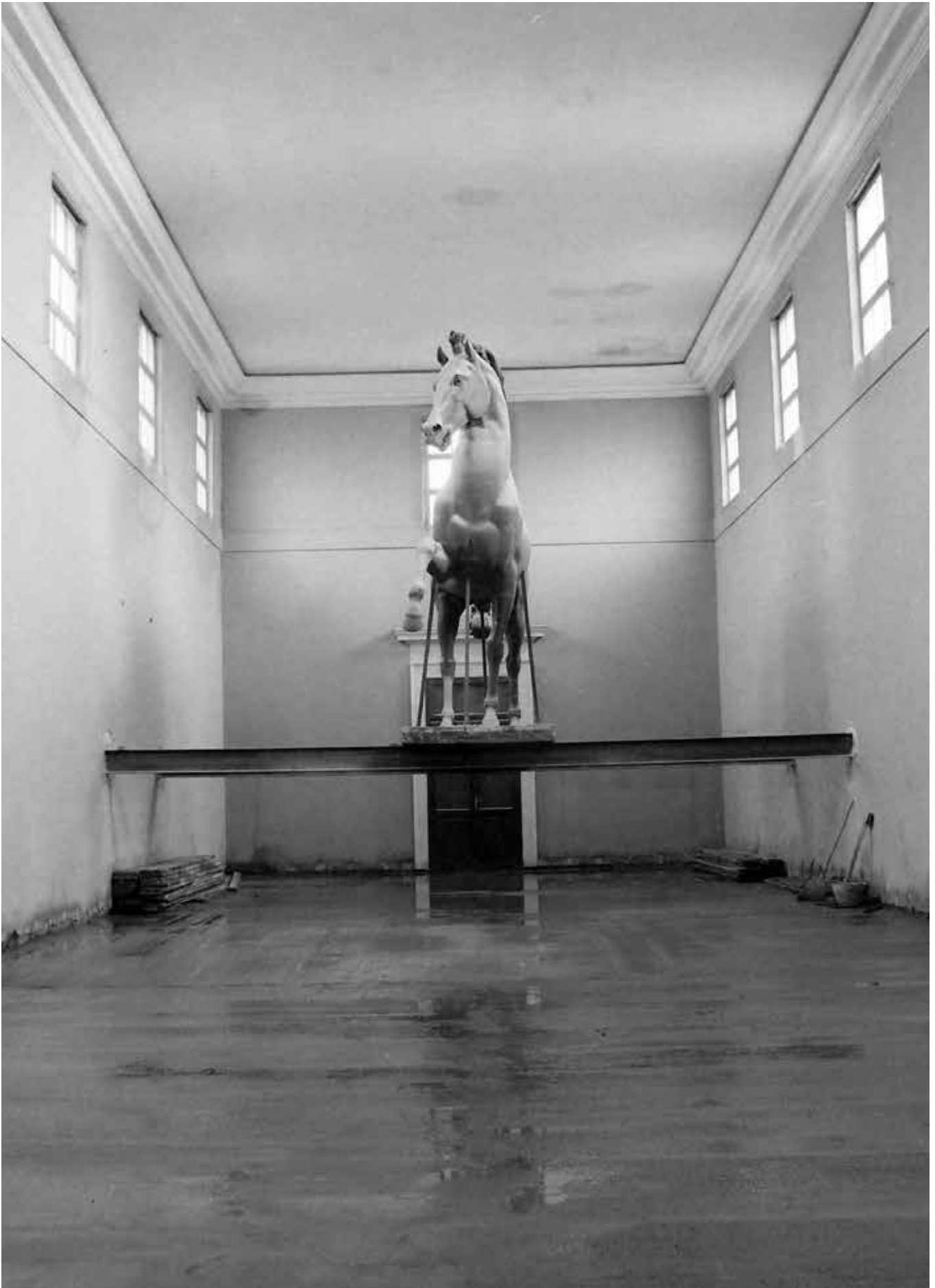
5. Salone Canova, Museo Civico di Bassano del Grappa, 1967-1969.