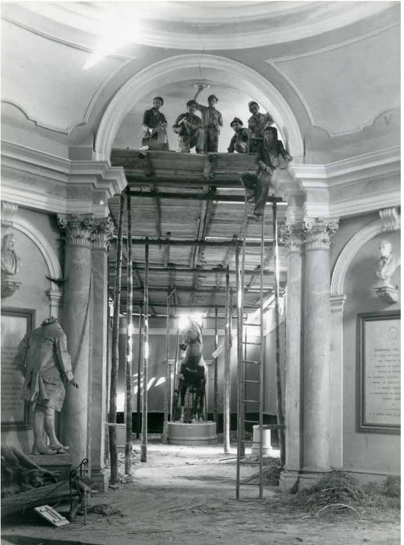
3. Ottagono superiore e Salone Canova, Museo Civico di Bassano del Grappa, 1950.